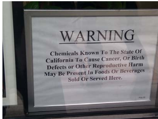
Fig.1: Avviso affisso in noto ristorante (Cheesecake Factory)