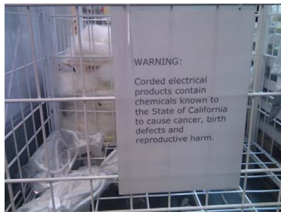
Fig.2: Avviso affisso in grande magazzino